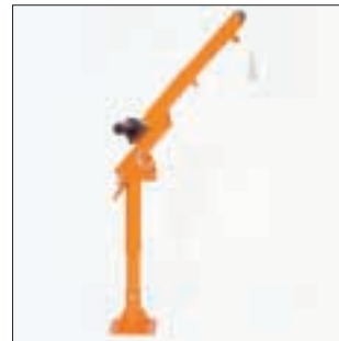
HUMMEL GSK 500 in der 45° Position