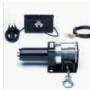
RULE INDUSTRIAL Seilwinde mit Fernbedienung 12 V oder 24 V