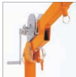
HUMMEL GSK 500 in manueller Ausführung