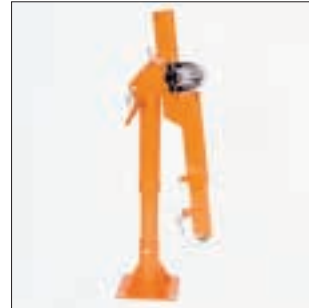
HUMMEL GSK 500 in Ruheposition